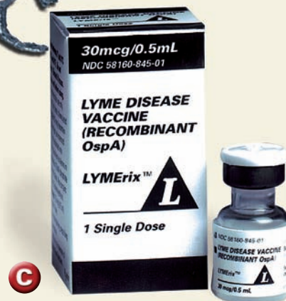
▲ La enfermedad de Lyme fue llamada así por la localidad que lleva el mismo nombre en el estado de Connecticut, EE.UU., donde se detectó la enfermedad. Por eso, la primera vacuna contra la borreliosis fue llamada LYMERix.