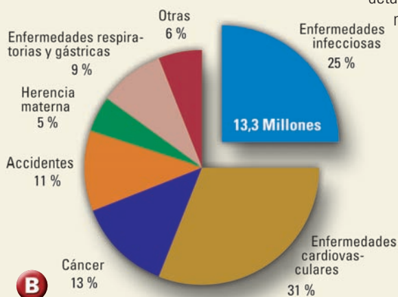
▲ Causas de los 53,9 millones de decesos en todo el mundo (Fuente: OMS, 1999).

→ En Europa es la afección transmitida por garrapatas más frecuente. Aproximadamente entre el 5 y 35% de las garrapatas están infectadas con borrelias. Según los estudios realizados hasta la fecha, después de ser picados por una garrapata, entre el 3 y el 6% de los afectados contrae una infección, en tanto que entre el 0,3 y el 1,4% contrae una enfermedad grave. En el caso de mordeduras