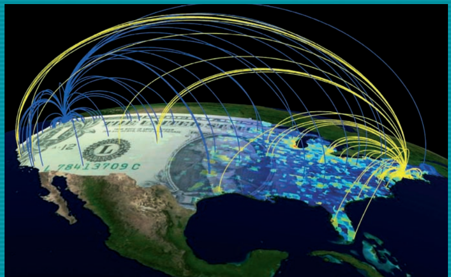
imagen simboliza el traslado geográfico de un dólar-billete en menos de una semana desde el lugar de partida (Seattle: azul, Nueva York: amarillo) hasta los diversos destinos. Sobre la base de sus estudios, los científicos de Gotinga han desarrollado una teoría que describe con asombrosa precisión los movimientos de viaje a distancias de unos pocos a varios miles de kilómetros. Se ha logrado así realizar un avance significativo en la modelización matemática de la expansión de epidemias.