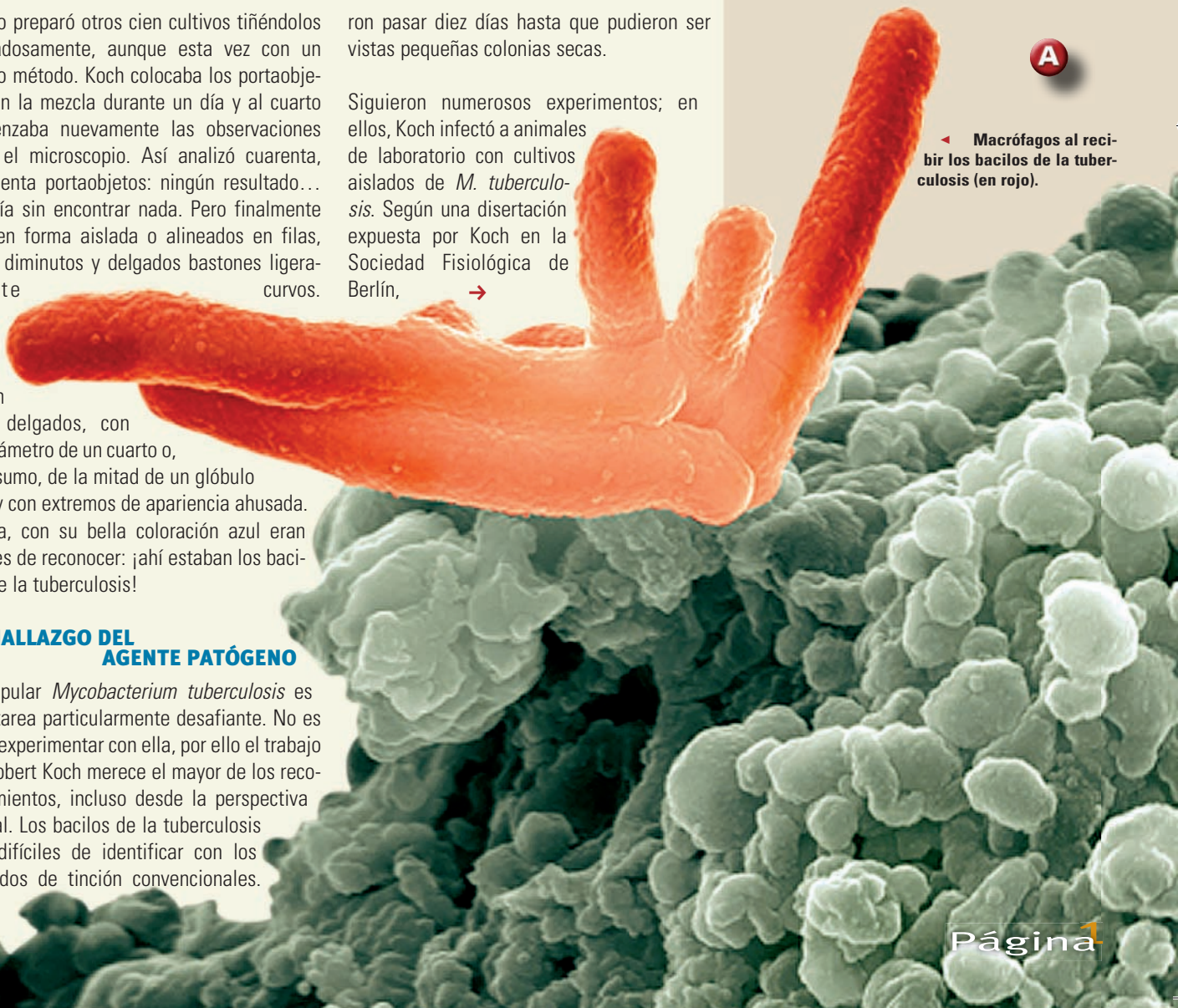
◀ Macrófagos al recibir los bacilos de la tuberculosis (en rojo).

Manipular Mycobacterium tuberculosis es una tarea particularmente desafiante. No es fácil experimentar con ella, por ello el trabajo de Robert Koch merece el mayor de los reconocimientos, incluso desde la perspectiva actual. Los bacilos de la tuberculosis son difíciles de identificar con los métodos de tinción convencionales.